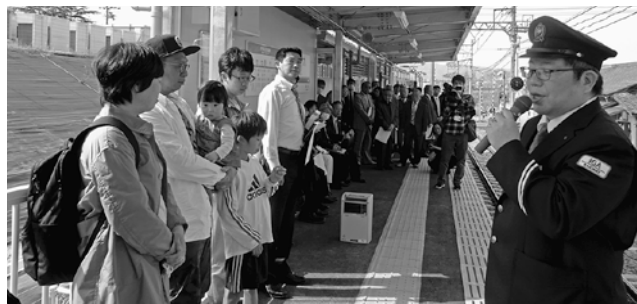
伊賀線新駅「四十九駅」記念式典

3月17日(土)の伊賀線新駅「四十九駅」開業に伴い、開業記念式典及び「四十九駅」の見学会が4月1日(日)に開催されました。新たなスタートを祝すとともに、これまで以上に地域が一体となって支える為、交通運輸部会では伊賀線新駅「四十九駅」見学会を開催し、2事業所9名の方にご参加いただきました。伊賀鉄道の新駅として、地域振興や伊賀線の活性化に期待される駅であり、大変有意義な見学会となりました。