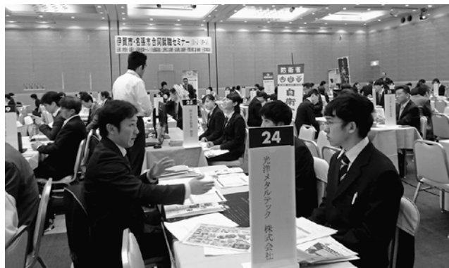
各社の採用担当者から説明を受ける様子

当日は来年度の新規採用を計画されている伊賀地域の事業所68社にご参加いただきました。また就職希望者は、大学卒業見込者のほか既卒者なども合わせ、97名の方にご来場いただきました。リクルートスーツ姿の来場者の皆様は、各社の採用担当者から会社の概要や雇用条件の説明を真剣な表情で受けていました。