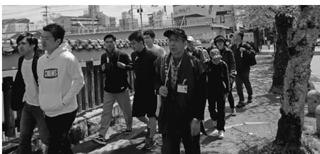
伊賀の名所を巡る

JR関西西線の利用促進と沿線の魅力を知っていたく為、ウォーキングを開催致しました。