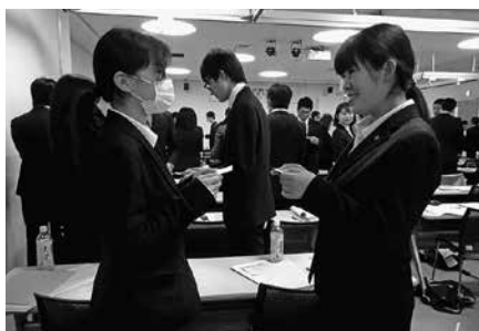
名刺交換の仕方を学ぶ