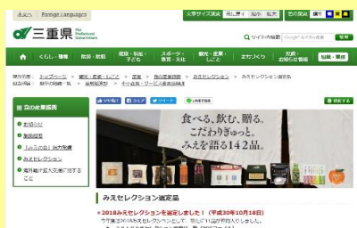
県政だよりや三重県ホームページ等への掲載