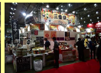
大都市圏での展示商談会への出展機会の創出