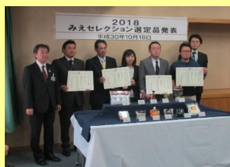
県庁で開かれた選定品発表会の様子

選定された事業者とともに、選定品の首都圏や大都市圏など全国に向けた情報発信に取り組んでいます。