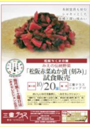
東京「三重テラス」毎月第3土曜日はみえセレクションの日