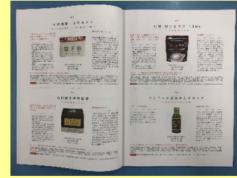
バイヤー向け冊子「みえセレクション選定商品カタログ」